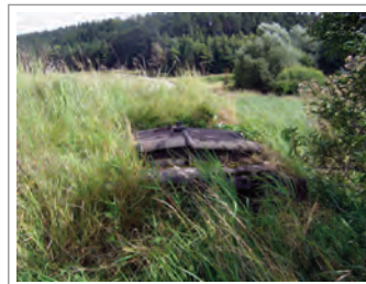
Widder im Siegental