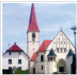
Pfarrkirche St. Maria, 15. Jahrhundert

Am Freyberg'schen Schloss und Rathaus vorbei, gelangen wir wieder zum Ausgangspunkt Bahnhof.