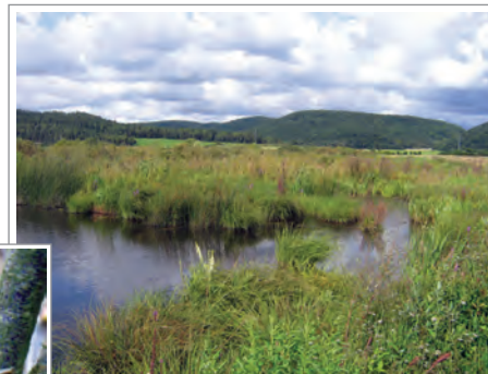
Naturschutzgebiet „Schmiechener See“