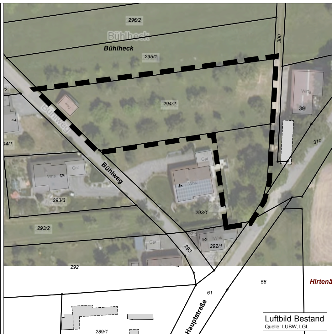
Luftbild Bestand