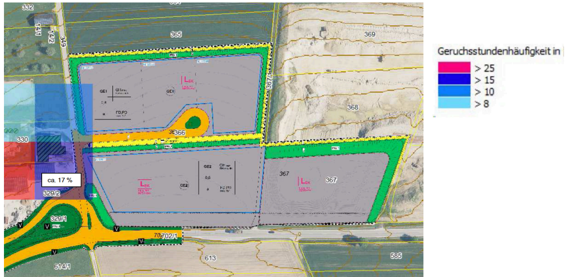
Abbildung 01 Darstellung Ergebnisse der Geruchsabschätzung vom 13.01.2023 (Programm: GERDA IV.3.05, Geruchseinheiten VDI-Richtlinie 3894, Datengrundlage: AZ 22-621.4 Schi vom 13.01.23), Bebauungsplan überholt.

Mit dem in Kraft treten der Technischen Anleitung zur Reinhaltung der Luft (TA Luft, 2021) am 01.12.2021 gelten neue Vorgaben für die Ermittlung von Geruchsimmissionen. Zudem wurden im Jahr 2022 der baurechtliche Bestandschutz einer Pferdehaltung (Flst. Nr. 330) vom Fachdienst Landwirtschaft festgestellt. Der Fachdienst Landwirtschaft hat die Geruchsabschätzung vom 19.11.21 entsprechend aktualisiert (siehe Abbildung).